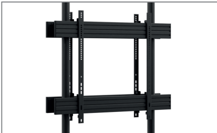
Montageseitig höhenverstellbar entlang der Poles