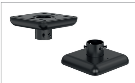
Sauberer Decken- und Bodenabschluss